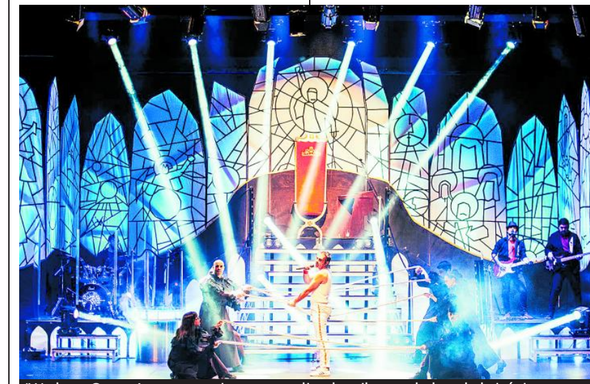
'We love Queen' es un concierto teatralizado tributo a la banda británica. :: L.N.C.