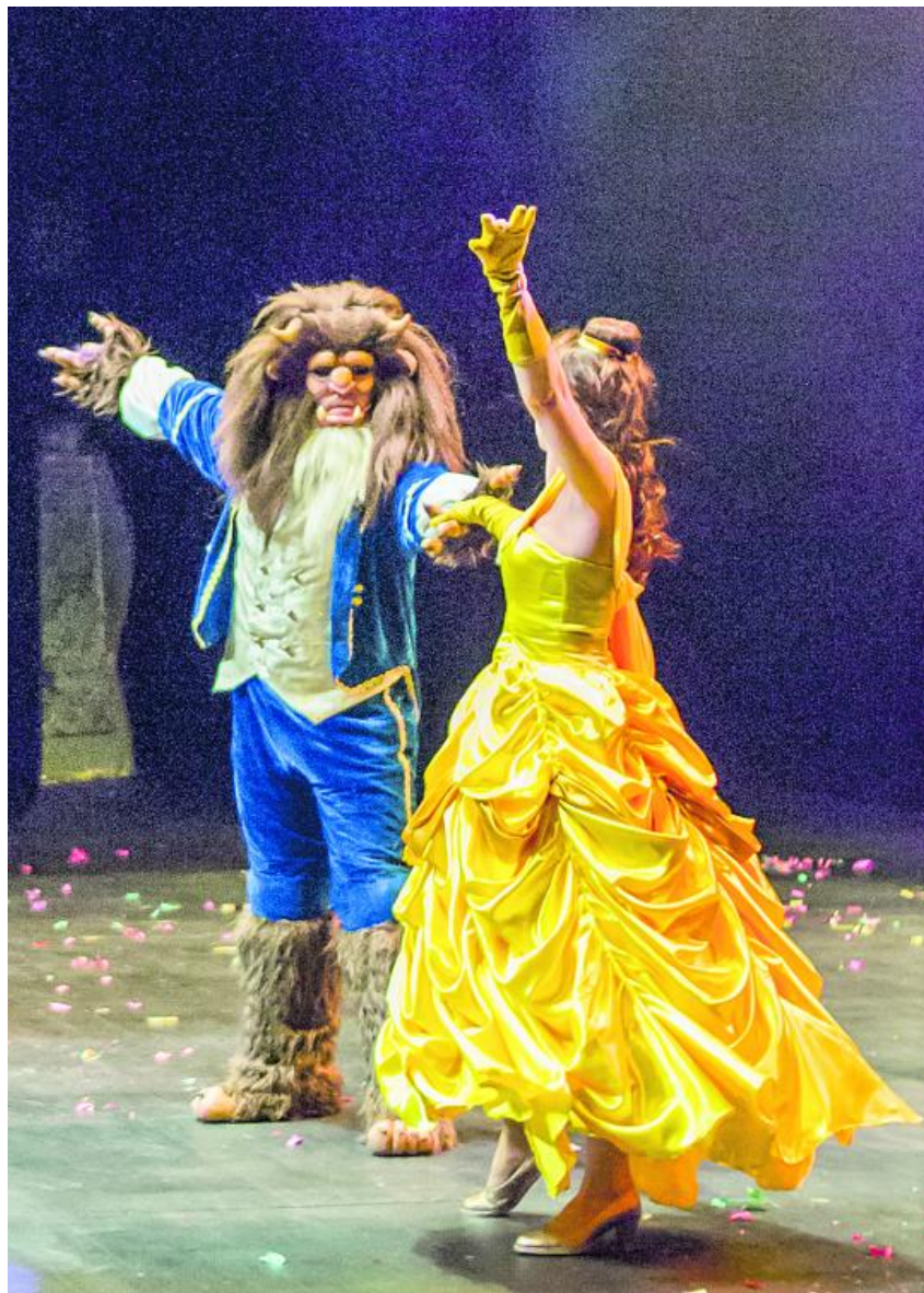
El musical 'La bella y la bestia' llega al León Arena el 23 de septiembre.

Mayumaná llega con el espectáculo 'Currents' que ilustra la rivalidad entre Edison y Tesla