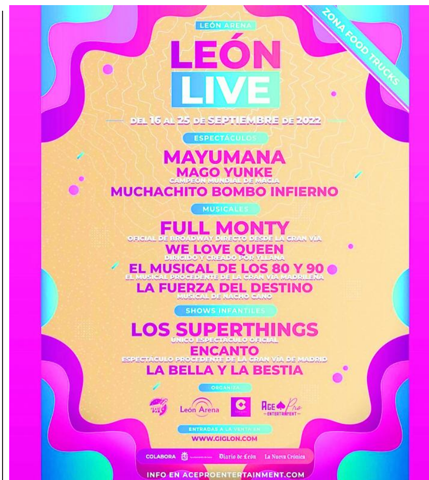
Cartel de la primera edición de 'León Live!' a celebrar en el León Arena.