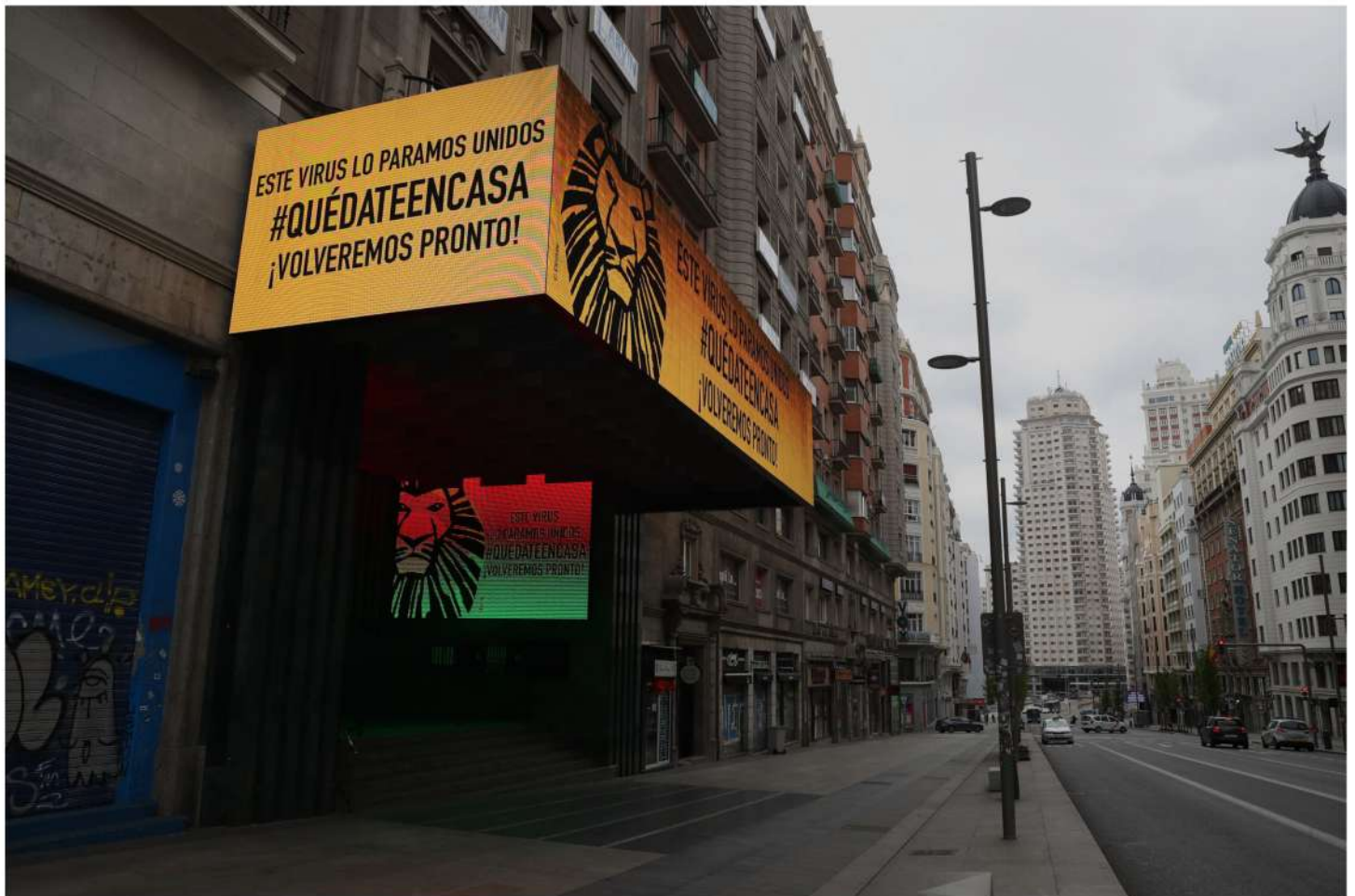
Teatro cerrado en la Gran Vía en Madrid durante marzo de 2020 debido a la pandemia de coronavirus.

Los espectáculos 'Kinky Boots', 'Grease', 'Ghost' o 'The Full Monty', entre otros, se instalarán en los teatros